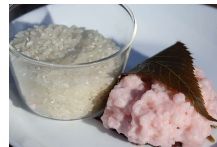
桜ライスプレティング (イメージ)