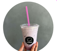
期間限定 いちごミルク