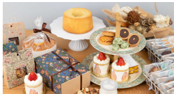
Riz Lie Amande (スイーツ)