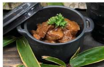
北海道大樹町「蝦夷鹿カレー」